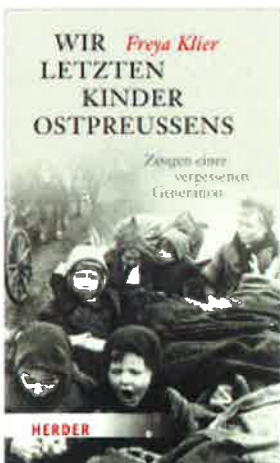
"Wir letzten Kinder Ostpreußens"

Louis Sachar: "Schlamm oder Die Katastrophe von Heath Cliff" Beltz, 192 Seiten, 12,95 Euro, ab 12